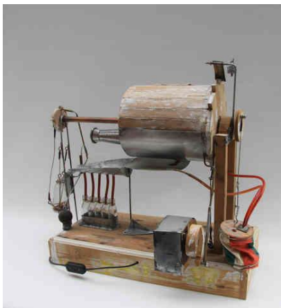
mechanieken van Zjos Meyvis

Warme groet van de hele makers- en spelersgroep